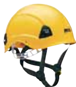
VERTEX BEST - työkypärä Pysyy päässä kaikissa työasennoissa.