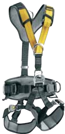
NAVAHO BOD FAST - valjas Kattotöistä mastoihin, erinomainen käyttömukavuus.