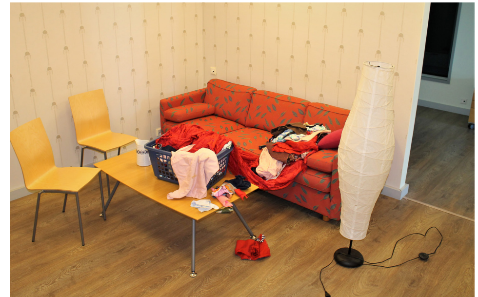
Kuva 1. Oppimisympäristö

Laurean Otaniemen kampukselle on aikoinaan rakennettu asuntoa muistuttava tila, jossa oli tarkoitus harjoitella erityisryhmien tukemista. Tilassa on myös akvaariotila lasin takana. Oppimisympäristö modifioitiin perhetyön simulaatioita varten. Tilassa oli valmiiksi rakennettuna eteinen, keittiö, olohuone sekä pesuhuone. Ennen jokaista simulaatiota oppimisympäristöä päätettiin muokata hieman erilaiseksi. Näin pyrittiin luomaan mahdollisimman autenttinen tila kyseiselle perheelle, esimerkiksi kodin lattialle heitettiin mainospostia ja/tai pyykkiä.