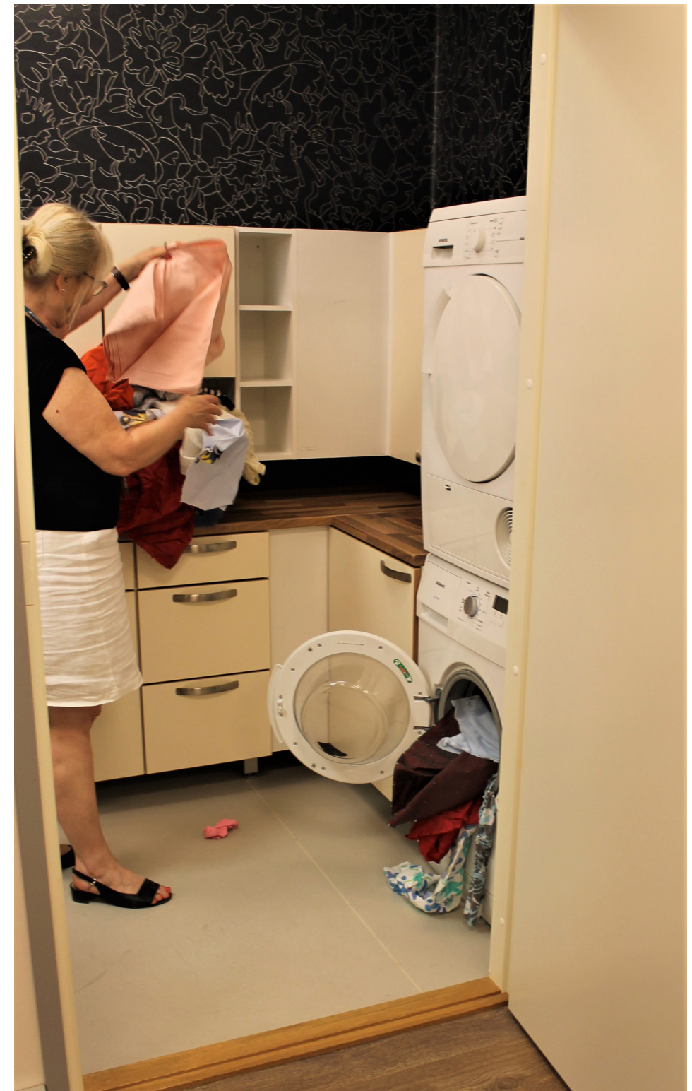
Kuva 2. Simulaation toteutus

Reflektiokeskustelu käytiin opiskelijaryhmän, näyttelijöiden, vertaisarviointiparin ja opettajien kesken hyväksikäyttäen reflektiolomakkeessa olevia teemoja. Simulaation tehneet opiskelijat tekivät itsearviointin. Vertaisarviointi suoritettiin samasta asiakasperheestä kuin mitä itse simuloivat. Näyttelijät panostivat palautteessaan erityisesti kohtaamiseen ja tunnetyöskentelyyn liittyviä asioita.