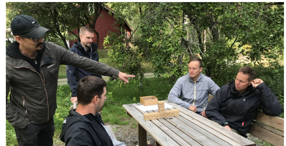
Kuva 1. Dialogipalikat RMRAM18 ryhmän kokeilussa