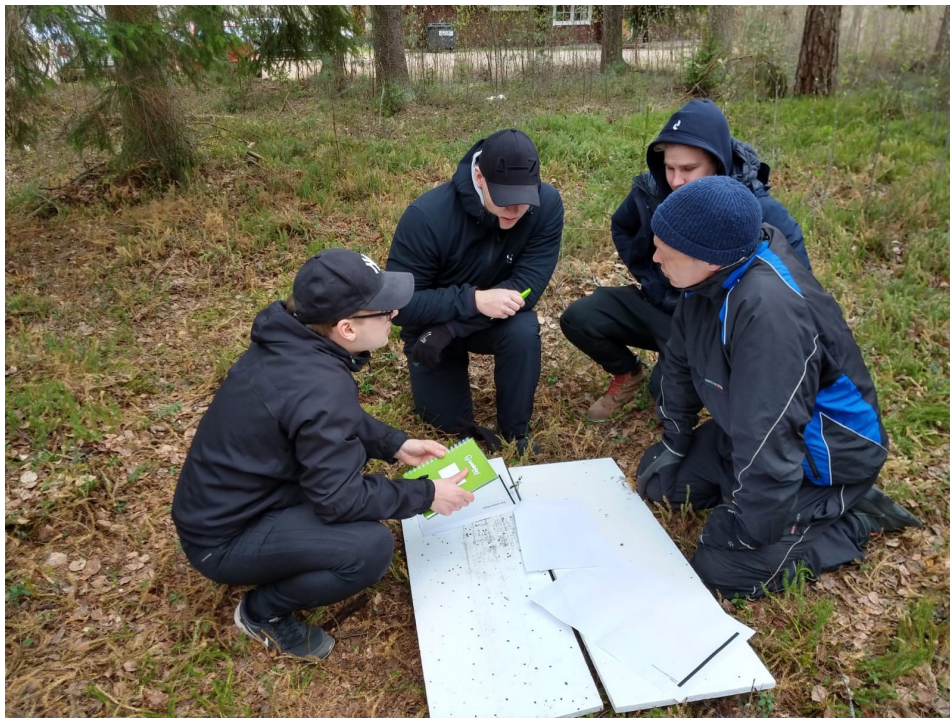
Kuva 2. INRAP17 ryhmän luontopäivässä työn alla rakennusprojektin verkosto

Hämeen ammattikorkeakoulun rakennusalan opiskelijoiden kanssa kokeiltiin koulutusmenetelmän kehiteillä olevaa versioita luontototeutuksella insinööriopiskelijaryhmä INRAP17:n kanssa Janakkalassa toukokuussa 2019 sekä rakennusmestareiden monimuotoryhmä RMRAM 18:n kanssa Laitikkalan kurssikeskuksessa syyskuussa. Toiminnan fasilitointiin saatiin taloudellista tukea rakennusmestarien säätiöltä. Opiskelijat työstivät luontorasteilla eri teemoja, kuten luottamusta, vuorovaikutusta, ajanhallintaa, laadunhallintaa ja rakentamisen prosessissa tarvittavaa verkostoa. Sosiaalialalta kotoisin olevat sisällöt otettiin pääsääntöisesti hyvin vastaan. Palautteessa näkyi positiivista innostuneisuutta, neutraaliutta ja myös sisältöjen sopivuuden kyseenalaistamista alalle. Jatkokehittelyssä panostetaan palautteen mukaisesti erityisesti teemojen välisen jatkuvuuden ja sidosten vahvistamiseen, jotta kokonaisuus olisi mahdollisimman johdonmukainen. Tarina nähtiin hyvänä välineenä teemojen työstämiseen, kun edellä mainitut sidokset kokonaisuuteen muokkaantuvat selkeämmäksi.