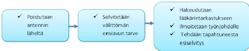
Kuva 1. Välittömät toimenpiteet ylialtistumistilanteessa