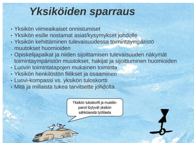
Kuva. Esimerkki yksiköiden sparrausten sisällöstä.

Sparrauksissa sovitut tavoitteet kirjataan kunkin yksikön tai tiimin normaalien palaverikäytäntöjen mukaisesti sähköisissä työtiloissa oleviin OneNote-muistikirjoihin, mikä varmistaa, että niitä seurataan jatkuvasti osana kunkin tiimin säännöllisiä palavereita. Tiimit itse määrittävät toimenpiteet, joilla sovitut tavoitteet saavutetaan. Luovin ruori toisaalta antaa tilaa tiimeille ja kannustaa uusien asioiden kokeilemiseen, vahvuuksien kehittämiseen ja vanhan kyseenalaistamiseen, mutta edellyttää myös vastuunottoa tulosten saavuttamisesta.