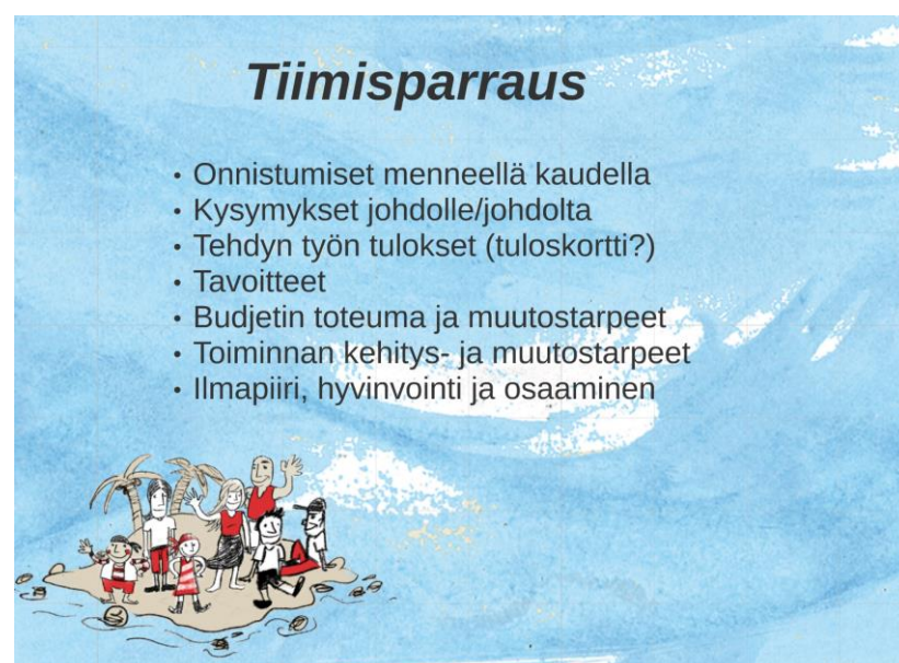
Kuva. Esimerkki tiimin sparrauksen sisällöistä.