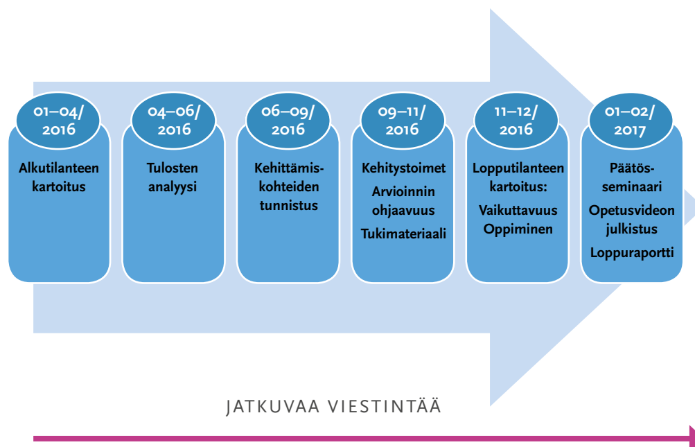
Kuvio 2. Tutkimuksen eteneminen